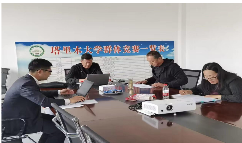
专家对大纲进行审核、论证

◆ 3月25日，为满足公共基础部教学需要，提高教学质量，公共基础部体育美育教研室特邀外校专家教授对我部体育美育大纲进行审核、论证，专家对我部体育美育大纲存在的问题进行反馈，提出相关整改意见。